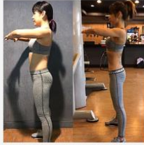
ลดน้ำหนักคอนนี้ น้ำหนักของคุณจะหายไป หากคุณเริ่มตอนกลางคืน