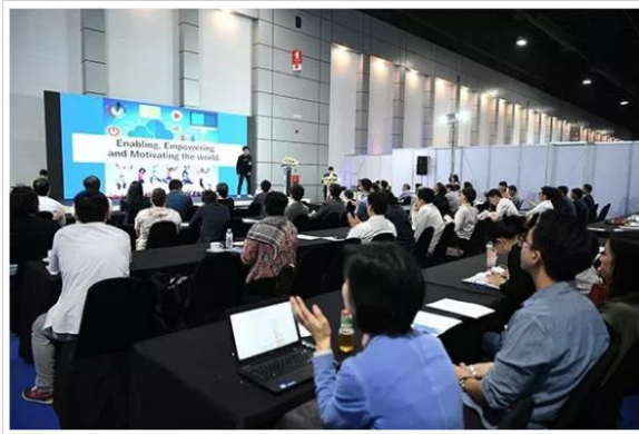
แฟ้มภาพ Cebit Asean 2018

และสมาคมอุตสาหกรรมซอฟต์แวร์ ย่อangk ที่จะนำผู้ประกอบการชั้นนำจากประเทศญี่ปุ่น และฮ่องกงมาร่วมจัดแสดงเทคโนโลยี ร่วมกับผู้ประกอบการจากประเทศเกาหลีใต้ ีหวัน จีน อินเดีย สิงคโปร์ และเยอรมนี เป็นต้น โดยมุ่งเน้น 4 กลุ่มสินค้าหลักที่จะเป็นตัวช่วยขับเคลื่อนธุรกิจคือ Data and Cloud, Business Solutions, Smart Solutions และ IoT, Cyber Security